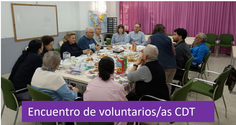
Encuentro de voluntarios/as CDT