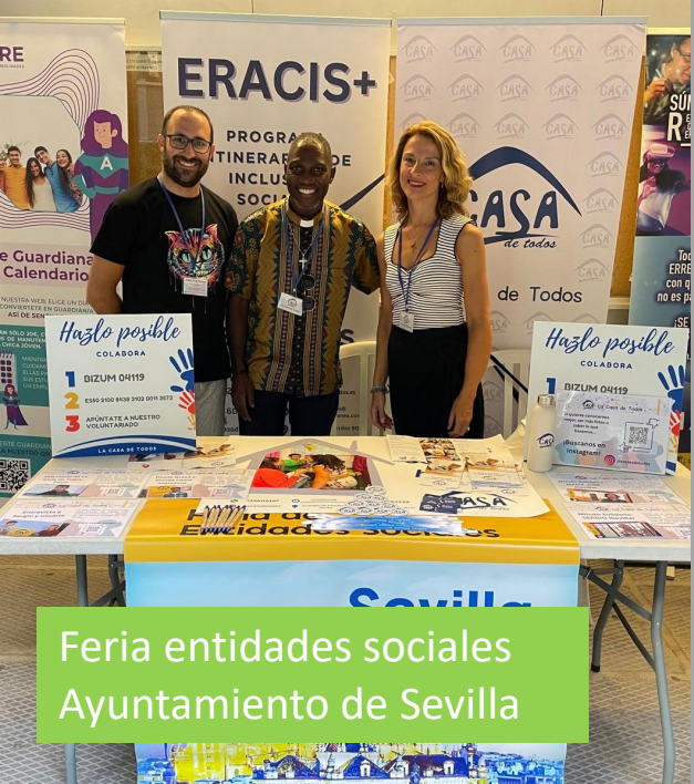
Feria entidades sociales Ayuntamiento de Sevilla