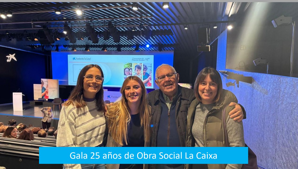
Gala 25 años de Obra Social La Caixa