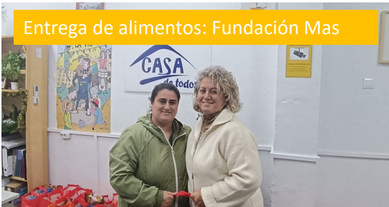
Entrega de alimentos: Fundación Mas