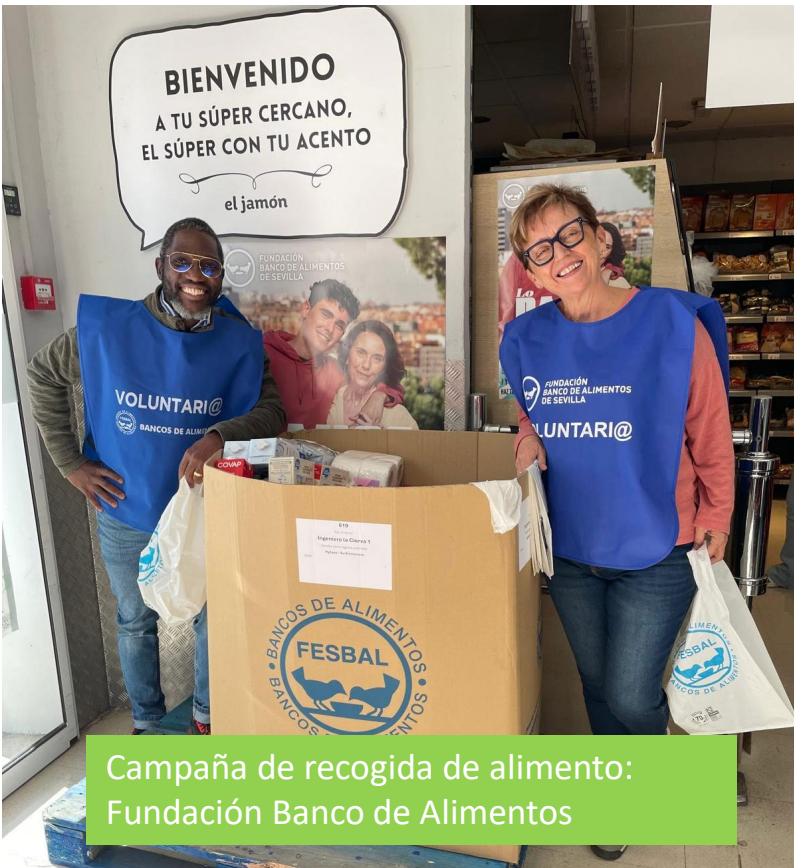
Campaña de recogida de alimento: Fundación Banco de Alimentos