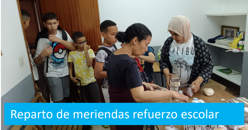
Reparto de meriendas refuerzo escolar