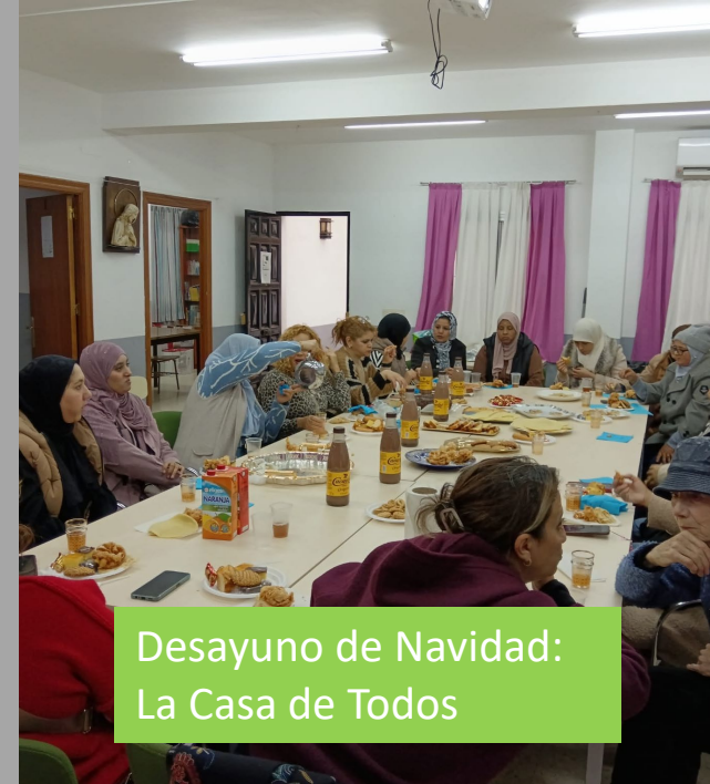
Desayuno de Navidad: La Casa de Todos