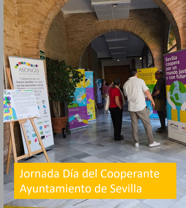
Jornada Día del Cooperante Ayuntamiento de Sevilla